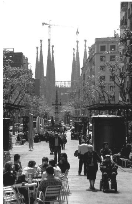
شکل ۴. توجه به کیفیت طراحی معبر براساس توجه به نیاز عابرین، بارسلونا