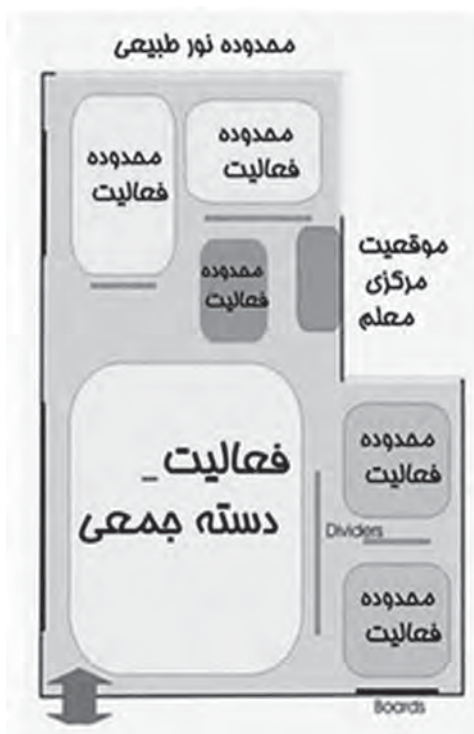
شکل ۳- الگوی کلاس L شکل

در این میان جیمز دیک فرم L عریض را به عنوان الگویی معرفی می‌نماید که معیارهای یک کلاس امروزی انعطاف‌پذیر را داراست و به معلمان حق انتخاب‌های متفاوتی در سازماندهی کلاسهایشان جهت تسهیل رشد دانش آموزان، در فعالیتهای متفاوت یادگیری را می‌دهد (شکل ۳) (Lippman, ۲۰۰۲) و (Dyck, ۱۹۹۴: ۴۱-۴۵).