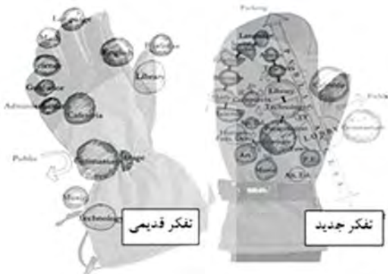
شکل ۲- الگوی فرانک لاکر برای ارتباط برنامه‌ها و امکانات (Locker, ۲۰۰۳)

فرانک لاکر نیز یکی از برنامه ریزان محیط‌های آموزشی بر این اعتقاد است که: اگرچه اغلب یک دستکش ۵ انگشتی به عنوان یک الگوی طراحی برای ارتباط برنامه‌ها و امکانات در نظر گرفته می‌شود، انعطاف‌پذیری برای آینده به صورت بهتری به یک دستکش دارای یکجا برای ۴ انگشت قابل تشبیه است (Locker, ۲۰۰۳).