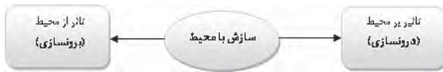
نمودار ۱- نحوه ارتباط کودک با محیط (مقدم، ۲۹، ۱۳۶۶)

نشان دهد، نیازمند محرک است، زیرا یادگیری در خلاء صورت نمی‌گیرد، بلکه نیاز به محرک داشته و تحریک اولین مرحله از گام‌های شناخته شده در جریان کارکرد فرایند خلاقیت است. از این رو به بستری نیازمندیم که وجود کودک را از یک خود محافظه کار به یک خود تجربه‌گرا تبدیل نماید (فیشر، ۱۳۸۶: ۷۹-۸۸).